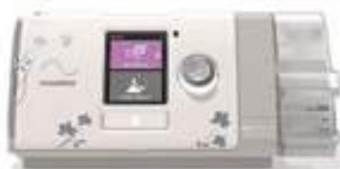
AIRSENSE AUTOSET S10 FOR HER RESMED