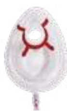
MÁSCARA ADULTO M