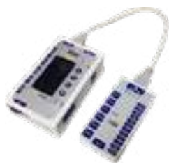
BRAIN WAVE MINI