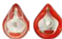
MÁSCARA ADULTO M