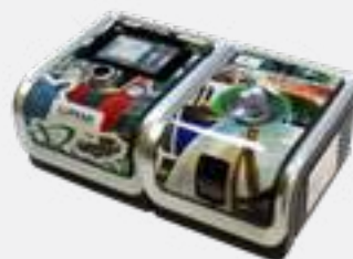
CPAP AUTO BMC GII