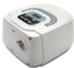
CPAP FIXO BMC