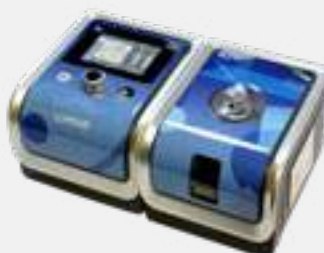
CPAP AUTO BMC GII