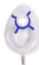
MÁSCARA ADULTO G