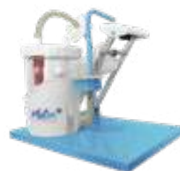
PLUTON E (C/PEDAL)

110W | CÓD: H003-C-110 220W | CÓD: H003-C-220