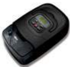
CPAP AUTO BMC GI