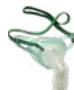
MÁSCARA DE TRACHEOSTOMIA

ADULTO|CÓD: OM-81620 INFANTIL|CÓD: OM-81640