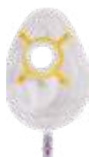
MÁSCARA ADULTO P