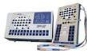
BRAIN WAVE III