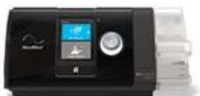
AIRSENSE AUTOSET S10 RESMED