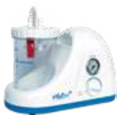
PLUTON B (BATERIA)

110W | CÓD: H003-A-110 220W | CÓD: H003-A-220