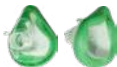
MÁSCARA ADULTO P