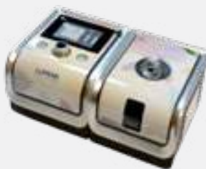
CPAP AUTO BMC GII