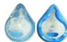
MÁSCARA ADULTO G