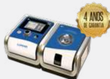
CPAP AUTO BMC GII