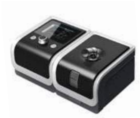
CPAP AUTO BMC GII